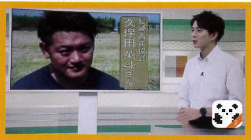
←7月6日に放送されたNHK「輝く人」に出演しました。