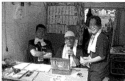
笑顔で対応します!!