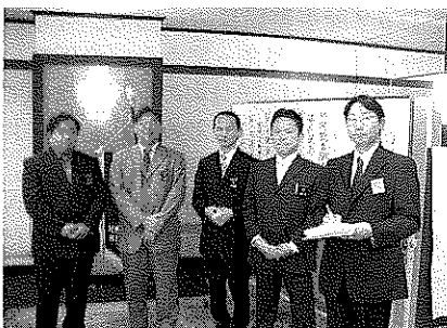
選挙管理委員会メンバー