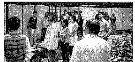
お疲れさまでした~

10月19日(金)に、割烹大判にて、おくんち広場の打ち上げが行われた。事業委員会の労をねぎらい、会員同士おくんち広場の出来事に話が尽きない様子であった。