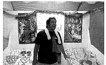
パチボールどうね？