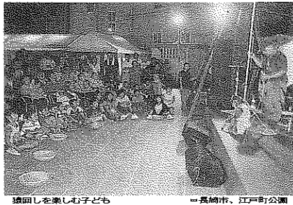
猿回しを楽しむ子ども 長崎市、江戸町公園

猿回し、籠踊り楽しむ 長崎くんちを昔前に六、七年開いている、今回は大日夜、障害者児童福祉施設 福祉施設のおおくんちを設け、おくんちを対等に 社団法人を招待した。会場では、籠踊りや猿回し、長崎市の江戸、まきなど十九の地区の町公園であった。子どもが遊ぶの、同市近郊のウーリーマン、ステージで披露された箇所や自業責つくと、籠踊り、モチコーイと天気を喜び、年寄り(黒髪洋装)のモチコーイと天気を喜び、主催、くんちを見物客の、一足早くくんち気分を少し味わって、モチコーイ。