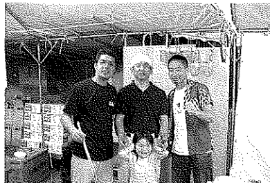
本番がんばります