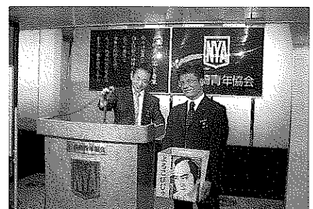
ヨロコビ お願いします