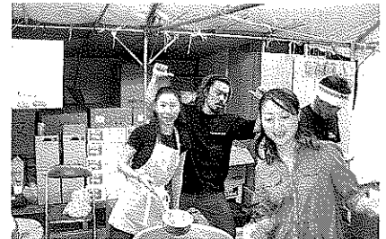
おいしいうどんいかが？