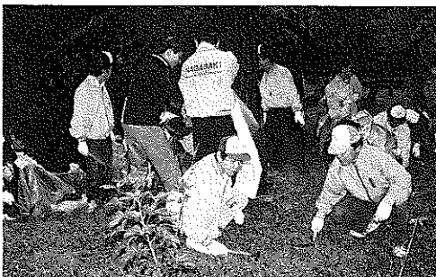
稲佐国際墓地清掃

1690年、出島に着任したオランダ商館医ケンペル(ドイツ人)は、町年寄について市長的役割と説明している。当時は1年毎に交代していたので年番とも呼ばれていたらしい。4月21日に行なわれ本島等氏が当選した市長選挙は、彼によれば町年寄選挙と言えるでしょう。時は移り現在の任期は4年、責任も江戸時代の4倍となり平成の町年寄として長崎の発展に尽力されることと思います。