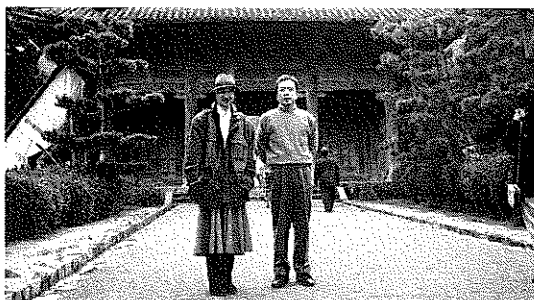
▲夫婦で山口県へ旅行したときのスナップ

私ははっきり“ヤクザにやられた！”と思い込みました。と云うのも、ヤクザの抗争事件の最中だったからです。担ぎこんだ病院では、私の頭と(病気で頭髮が真っ白なのです。)飲酒運転の主人を(中年の)暴走族の夫婦とみられたようです。