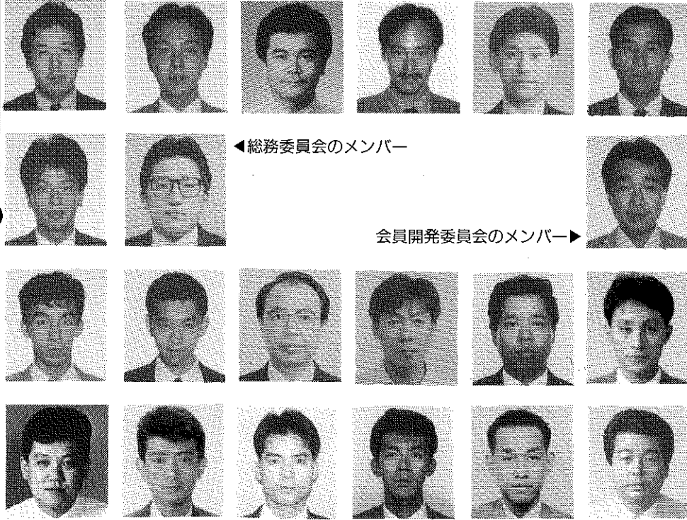
◀総務委員会のメンバー