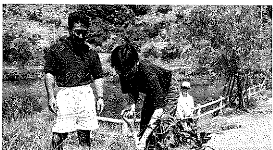
ぶらぶらラリー優勝ペアによる記念植樹