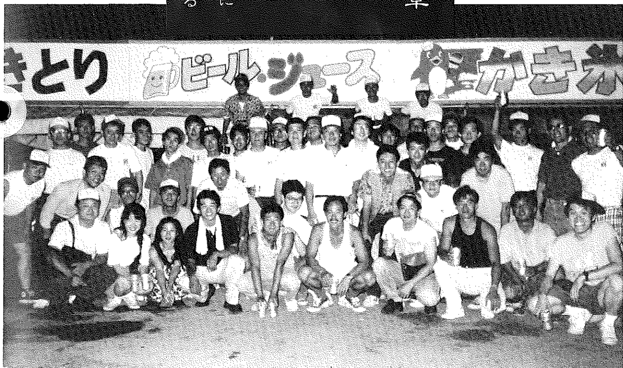
海のフェスティバル (松ヶ枝国際観光埠頭にて)