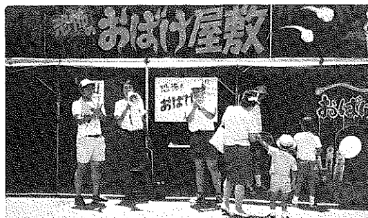
呼び込みに熱の入るおばけ屋敷

29日は昼2時に始まり暑いこともあり、冷たいものが飛ぶように売れ、また、夕方からはサンバ