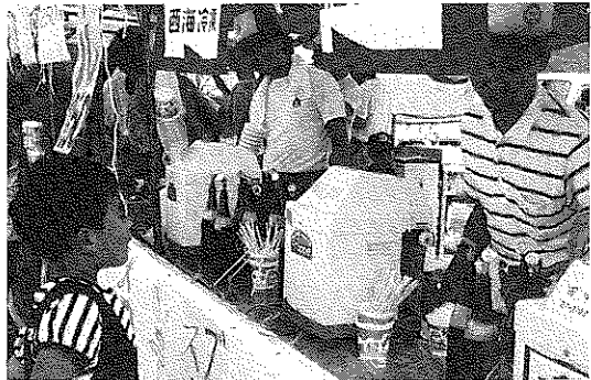
かき氷が飛ぶように売れました。

29日は昼2時に始まり暑いこともあり、冷たいものが飛ぶように売れ、また、夕方からはサンバ