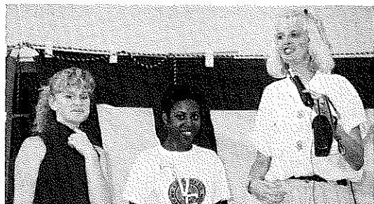
留学生による自己紹介