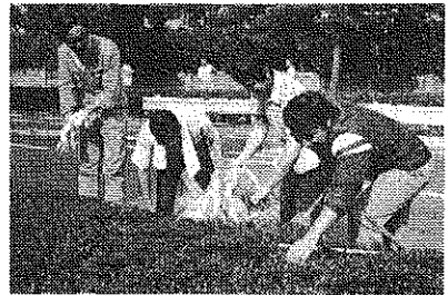
清掃中の会員 新興善小前グリーンベルト