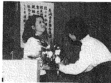
弘津君長い間お疲れ様