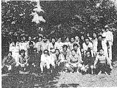
汗まみれの顔 (記事は後頁)