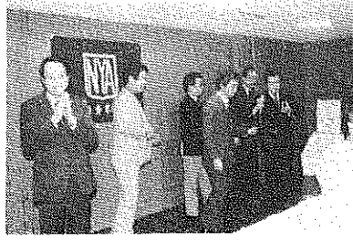
本年度各理事の紹介