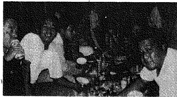
昭和五十五年九月十三日 四日、大村月光の里で