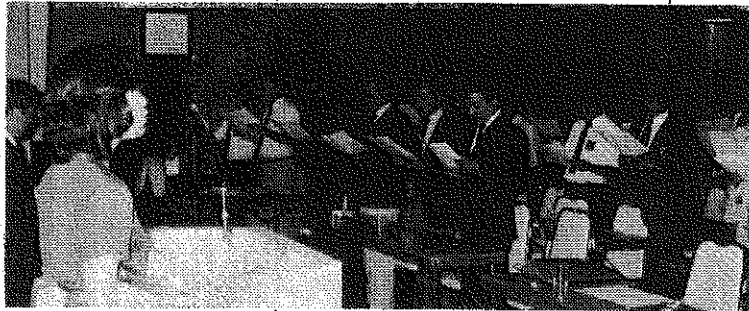
長崎青年協会の歌 昭和五十五年九月二十日 例会で初練習をする。

に「長崎の青年協会はほんとうにすばらしい団体ですね若い君たちが力を合わせて老人を慰める、こんなことは最近の若者ではできない事と思います又、ほんとうにまとまった団体ですね次回になにかある時は是非もう一度私を呼んでくださいなとかしておじやまします。本日の老人達の姿を見ていると私も芸の道を進んでほんとうによかったと思います。ほんとうにありがとうございます」というあいさつでした。 この話を聞いていた全会員は、ほんとうに成功したのだ、やったのだという感激に酔ったものでした。この感激を忘れないよう私はつとめてきました。青年協会万才ノ