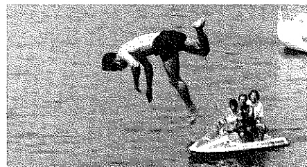
昨年コンテスト風景