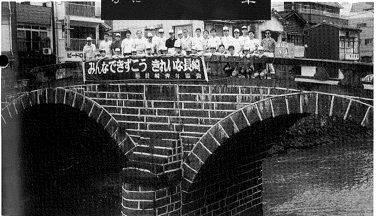
新人研修 (中島川にて)