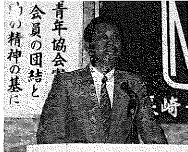
青年協会の 会員の団結と その精神の基

例年になく雨の多い九月でございます。台風の影響もあるのですが、九月の雨の冷たさを感じておられます。九月十三日、十四日に全体研修が行なわれました。今年度は、キャンプ形式という事で実施されたんですが、深夜にまでおよぶデイスカッションは、新たな会員同志の団結を生み出したと思います。九月二十一日青年会議所が主催いたしました出島バージェントに参