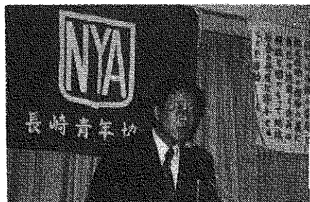
次年度会長の横顔