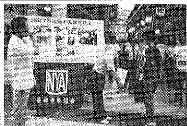
7月30日・31日アーケードにて 義援金募集活動行